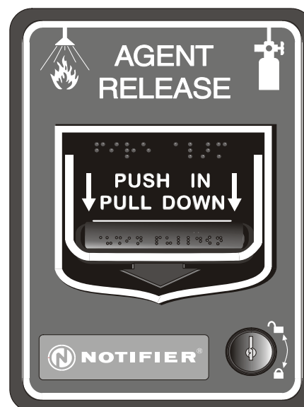
NBG-12LR de ação dual

FDNY: #6058 (NFS2-3030), #6038 (NFS2-640)