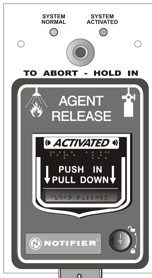
NBG-12LR de ação dual (mostrado ativo)